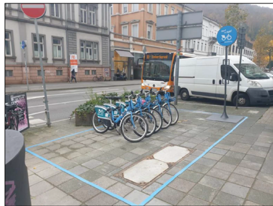
Plöck / Bismarckplatz